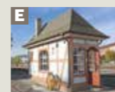
Bedienbares Stellwerk mit Signalen