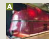
05 001 Schnellzuglokomotive