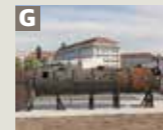
Kessel 01 150