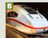
Mock-up des ICx