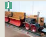
Erste Elektrolokomotive von Siemens (Nachbau)