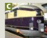
Schnelltriebwagen „Fliegender Hamburger“